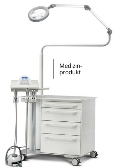
Behandlungseinheit ATLAS: Abb. mit Waldmann Ringlupen- leuchte LED Basic*