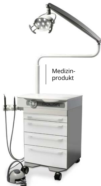
Behandlungseinheit POLAR: Schubladenfronten und Aluminiumgriffleisten weiß (Variante Basic) Abb. mit SUN LED*