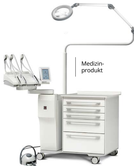
Behandlungseinheit LUNAR: (mit Modul LUNAR B) Abb. mit Wald- mann Ringlupenleuchte LED Basic*